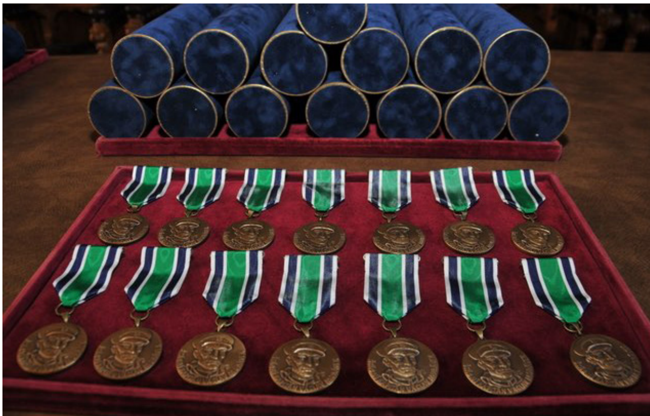
Čestný odznak štábního kapitána Václava Morávka